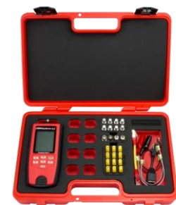
T130K4 Network & Coax Field Kit